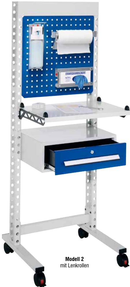
Modell 2 mit Lenkrollen