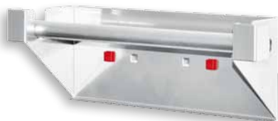
Abrollhalter Kern-Ø min. 22 mm, max. Rollenbreite 295 mm