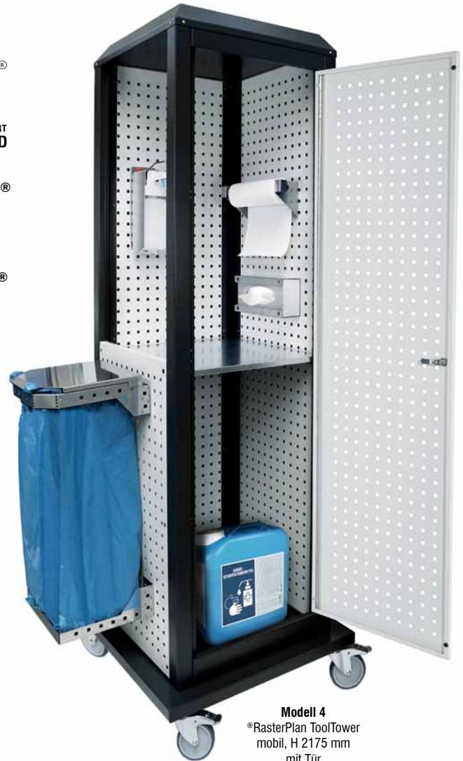
Modell 4 ® RasterPlan ToolTower mobil, H 2175 mm mit Tür