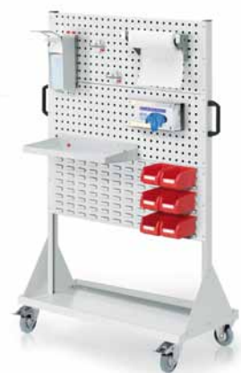
RasterMobil® Größe 4 - H 1580 x B 1000 x T 500 mm