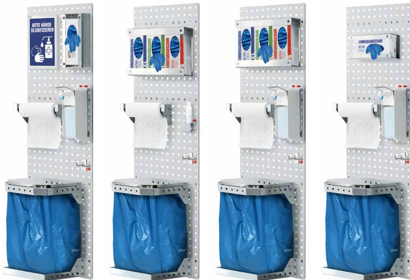
® RasterPlan Lochplatten - H 1500 x B 450 mm