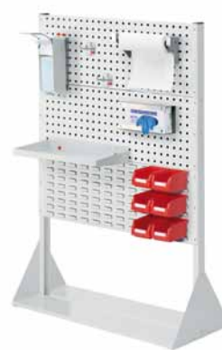
®RasterPlan Stellwände Größe 4 - H 1450 x B 1000 x T 430 mm