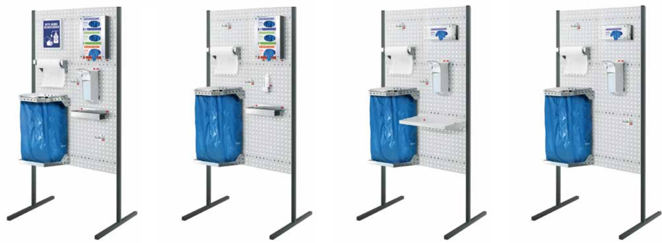
®RasterPlan Trennwände - H 2000 x B 1000 mm

ORGANISATION. ORDNUNG. SCHUTZ DURCH TRENNWÄNDE.