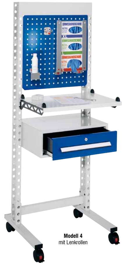
Modell 4 mit Lenkrollen