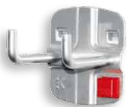
Doppelter Werkzeughalter mit senkrechtem Hakenende