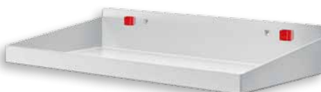
Stahlboden mit Abrollrand