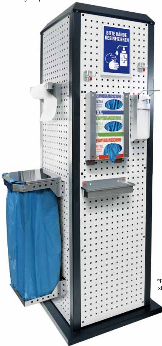
Modell 1 ® RasterPlan ToolTower stationär, H 2015 mm ohne Tür